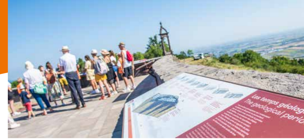
Panneau d'information sur le plateau de Gergovie