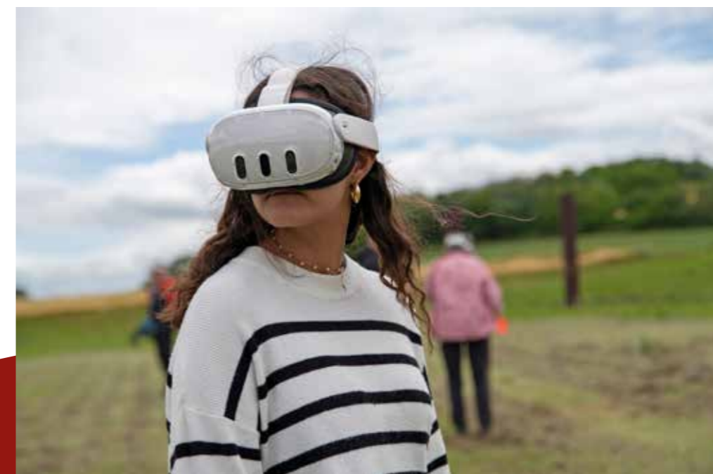
Animation en réalité virtuelle