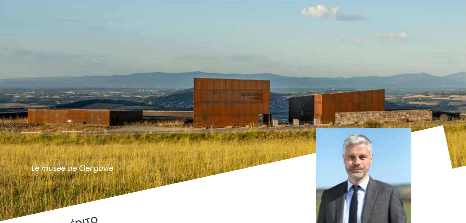
Le musée de Gergovie