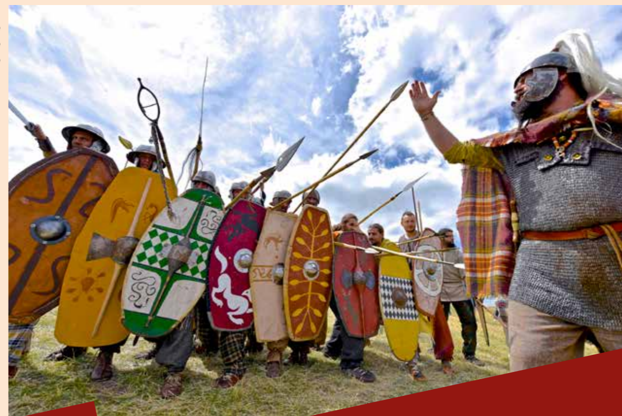
Reconstitution de la bataille de Gergovie

Après le soulèvement général des Gaules, initié par les Carnutes à Cenabum (Orléans), les Arvernes et plusieurs autres peuples gaulois s'unissent sous la direction de Vercingétorix pour résister à l'avancée romaine, menée par Jules César. Suite à la chute d'Avaricum (Bourges) et au massacre de sa population, la guerre se déplace vers les terres de Vercingétorix, au cœur de la Gaule. César décide alors d'assiéger l'oppidum de Gergovie, une forteresse naturelle située sur le plateau, pour tenter de briser la résistance gauloise. Après 3 jours de bataille, le chef gaulois parvient à repousser les assauts romains à l'aide d'une défense acharnée et à l'avantage du terrain. Les Arvernes et leurs alliés triomphent et sont rejoints par les Eduens qui abandonnent les Romains. Cette victoire gauloise signe la première défaite de Jules César, renforce la résistance contre l'occupation romaine et devient un symbole de la lutte pour l'indépendance.