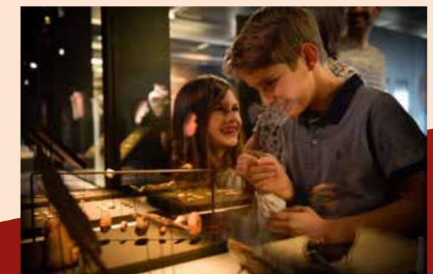
Objets du quotidien