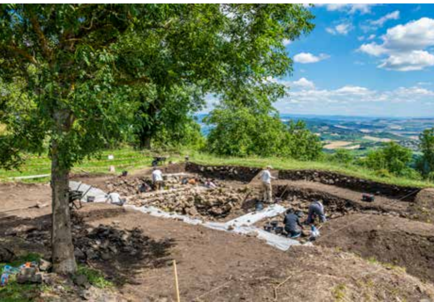
Chantier de fouilles à Gergovie

Le plateau de Gergovie est plus que jamais un lieu de recherches archéologiques. Depuis 2022 et jusqu'en 2025 s'est tenu ainsi un chantier de fouilles situé sur le Quartier des Artisans. Il visait à mieux comprendre ce secteur majeur du site de Gergovie, complexe à interpréter malgré plusieurs campagnes de fouilles déjà conduites.